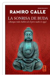
LA SONRISA DE BUDA CALLE CAPILLA, RAMIRO