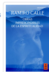
OBRAS IMPRESCINDIBLES DE LA ESPIRITUALIDAD CALLE CAPILLA, RAMIRO