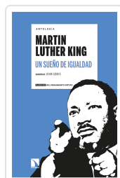
ANTOLOGÍA MARTIN LUTHER KING. UN SUEÑO DE IGUALDAD GOMIS, JOAN / DEL BUEY CAÑAS, RAMÓN