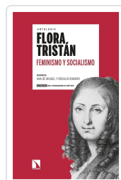
FEMINISMO Y SOCIALISMO TRISTÁN, FLORA