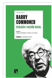
ANTOLOGÍA BARRY COMMONER ECOLOGÍA Y ACCIÓN SOCIAL RIECHMANN, JORGE/TELLECHEA, IRANZU