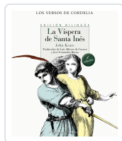
LA VÍSPERA DE SANTA INÉS KEATS, JOHN