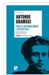
PARA LA REFORMA MORAL E INTELLECTUAL GRAMSCI, ANTONIO