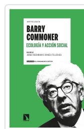
ANTOLOGÍA BARRY COMMONER ECOLOGÍA Y ACCIÓN SOCIAL RIECHMANN, JORGE/TELLECHEA, IRANZU