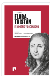
FEMINISMO Y SOCIALISMO TRISTÁN, FLORA