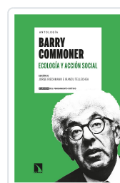
ANTOLOGÍA BARRY COMMONER ECOLOGÍA Y ACCIÓN SOCIAL RIECHMANN, JORGE/TELLECHEA, IRANZU