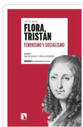
FEMINISMO Y SOCIALISMO TRISTÁN, FLORA