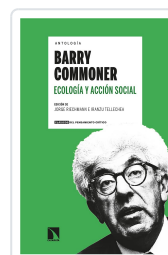
ANTOLOGÍA BARRY COMMONER ECOLOGÍA Y ACCIÓN SOCIAL RIECHMANN, JORGE/TELLECHEA, IRANZU