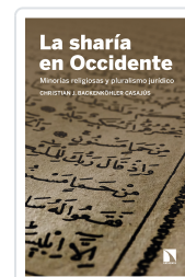
LA SHARÍA EN OCCIDENTE BACKENKÖHLER CASAJÚS, CHRISTIAN J.