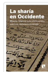
LA SHARÍA EN OCCIDENTE BACKENKÖHLER, CHRISTIAN