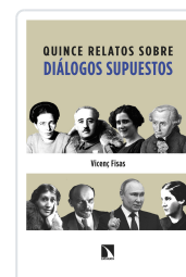
QUINCE RELATOS SOBRE DIÁLOGOS SUPUESTOS FISAS ARMENGOL, VICENÇ