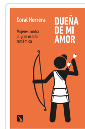
DUEÑA DE MI AMOR HERRERA, CORAL