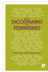
BREVE DICCIONARIO DE FEMINISMO COBO BEDIA, ROSA / RANEA TRIVIÑO, BEATRIZ