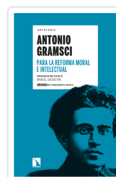
PARA LA REFORMA MORAL E INTELLECTUAL GRAMSCI, ANTONIO