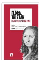
FEMINISMO Y SOCIALISMO TRISTÁN, FLORA