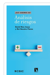
ANÁLISIS DE RIESGOS RÍOS INSUA, DAVID/NAVEIRO FLORES, ROÍ