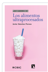
LOS ALIMENTOS ULTRAPROCESADOS SÁNCHEZ PERONA, JAVIER