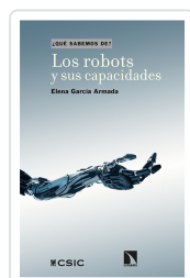
LOS ROBOTS Y SUS CAPACIDADES GARCÍA ARMADA, ELENA