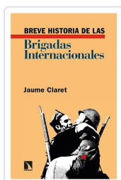
BREVE HISTORIA DE LAS BRIGADAS INTERNACIONALES CLARET, JAUME