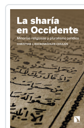
LA SHARÍA EN OCCIDENTE BACKENKÖHLER, CASAJÚS, CHRISTIAN J.