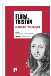
FEMINISMO Y SOCIALISMO TRISTÁN, FLORA