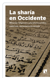
LA SHARÍA EN OCCIDENTE BACKENKÖHLER CASAJUS, CHRISTIAN J.