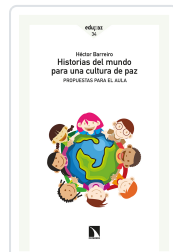
HISTORIAS DEL MUNDO PARA UNA CULTURA DE PAZ BARREIRO, HÉCTOR