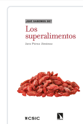
LOS SUPERALIMENTOS PÉREZ JIMÉNEZ, JARA