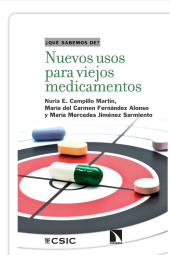
NUEVOS USOS PARA VIEJOS MEDICAMENTOS CAMPILLO MARTÍN, NURIA E. / FERNÁNDEZ ALONSO, MARÍA DEL CARMEN / JIMÉNEZ SARMIE