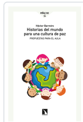
HISTORIAS DEL MUNDO PARA UNA CULTURA DE PAZ BARREIRO, HÉCTOR