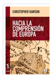
HACIA LA COMPRENSIÓN DE EUROPA DAWSON, CHRISTOPHER