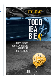
TODO IBA BIEN DÍAZ, ITXU