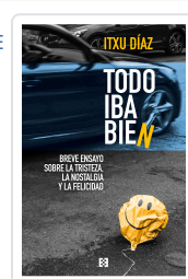
TODO IBA BIEN DÍAZ, ITXU