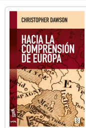
HACIA LA COMPRENSIÓN DE EUROPA DAWSON, CHRISTOPHER