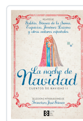
LA NOCHE DE NAVIDAD. CUENTOS DE NAVIDAD II GÓMEZ FERNÁNDEZ, FRANCISCO JOSÉ