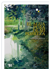
EL AGUA PURA DE MI POBREZA NEGRI, ADA