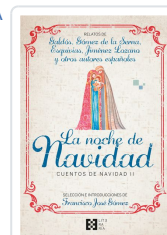
LA NOCHE DE NAVIDAD. CUENTOS DE NAVIDAD II GÓMEZ FERNÁNDEZ, FRANCISCO JOSÉ