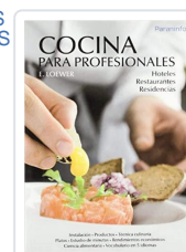
COCINA PROFESIONALES LOEWER, E.