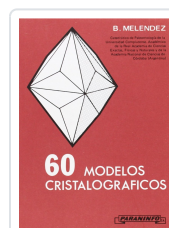
SESENTA MODELOS CRISTALOGRAFICOS MELENDEZ, B.