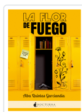
LA FLOR DE FUEGO QUINTAS GARCÍANDIA, ALBA