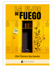
LA FLOR DE FUEGO QUINTAS GARCÍANDIA, ALBA