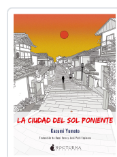
LA CIUDAD DEL SOL PONIENTE YUMOTO, KAZUMI