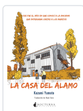
LA CASA DEL ÁLAMO YUMOTO, KAZUMI