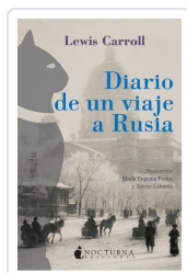
DIARIO DE UN VIAJE A RUSIA CARROLL, LEWIS