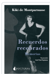
RECUERDOS RECUPERADOS. MEMORIAS KIKI DE MONTPARNASSE