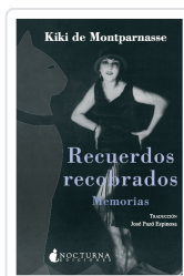
RECUERDOS RECUPERADOS. MEMORIAS KIKI DE MONTPARNASSE