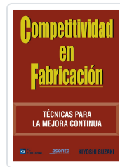
COMPETITIVIDAD EN FABRICACIÓN KIYOSHI SUZAKI