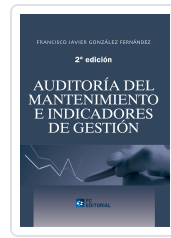
AUDITORÍA DEL MANTENIMIENTO E INDICADORES DE GESTIÓN. 2ª ED. FRANCISCO JAVIER GONZÁLEZ FERNÁNDEZ