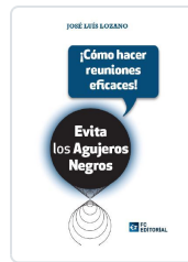
EVITA LOS AGUJEROS NEGROS ¡COMO HACER REUNIONES EFICACES! LOZANO PÉREZ, JOSÉ LUIS