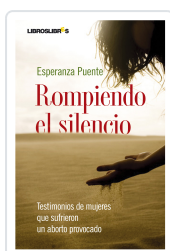
ROMPIENDO EL SILENCIO ESPERANZA PUENTE