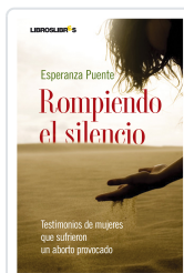
ROMPIENDO EL SILENCIO ESPERANZA PUENTE