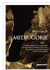
MEDJUGORJE JESÚS GARCÍA