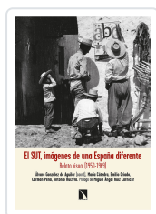
EL SUT, IMÁGENES DE UNA ESPAÑA DIFERENTE GONZÁLEZ DE AGUILAR, ÁLVARO