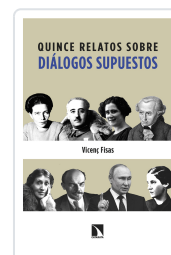
QUINCE RELATOS SOBRE DIÁLOGOS SUPUESTOS FISAS ARMENGOL, VICENÇ