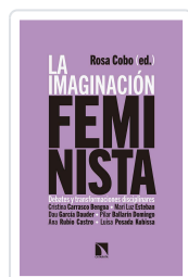
LA IMAGINACIÓN FEMINISTA COBO ED., ROSA