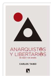
ANARQUISTAS Y LIBERTARIOS DE AQUÍ Y DE AHORA TAIBO, CARLOS