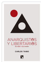
ANARQUISTAS Y LIBERTARIOS DE AQUÍ Y DE AHORA TAIBO, CARLOS