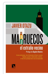
MARRUECOS, EL EXTRAÑO VECINO OTAZU ELCANO, JAVIER