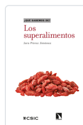
LOS SUPERALIMENTOS PÉREZ JIMÉNEZ, JARA