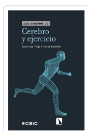
CEREBRO Y EJERCICIO TREJO, JOSÉ LUIS / SANFELIU, CORAL