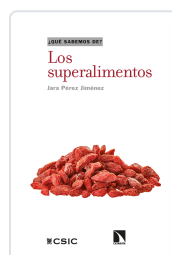
LOS SUPERALIMENTOS PÉREZ JIMÉNEZ, JARA