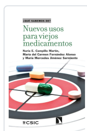
NUEVOS USOS PARA VIEJOS MEDICAMENTOS CAMPILLO MARTÍN, NURIA E. / FERNÁNDEZ ALONSO, MARÍA DEL CARMEN / JIMÉNEZ SARMIE