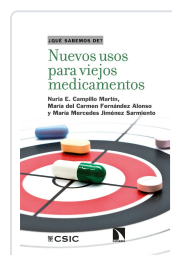
NUEVOS USOS PARA VIEJOS MEDICAMENTOS CAMPILLO MARTÍN, NURIA E. / FERNÁNDEZ ALONSO, MARÍA DEL CARMEN / JIMÉNEZ SARMIE