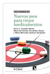
NUEVOS USOS PARA VIEJOS MEDICAMENTOS CAMPILLO MARTÍN, NURIA E. / FERNÁNDEZ ALONSO, MARÍA DEL CARMEN / JIMÉNEZ SARMIE