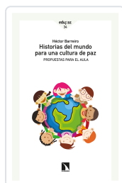
HISTORIAS DEL MUNDO PARA UNA CULTURA DE PAZ BARREIRO, HÉCTOR