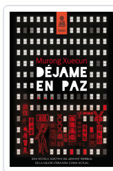
DÉJAME EN PAZ XUECUN, MURONG