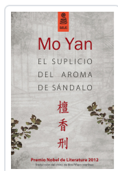
EL SUPLICIO DEL AROMA DE SÁNDALO (3ª ED.) YAN, MO