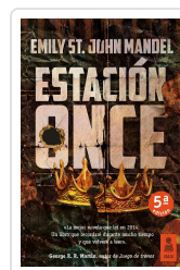
ESTACIÓN ONCE (7ª ED.) MANDEL, EMILY ST. JOHN