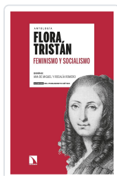
FEMINISMO Y SOCIALISMO TRISTÁN, FLORA