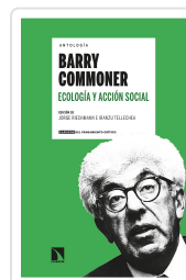
ANTOLOGÍA BARRY COMMONER ECOLOGÍA Y ACCIÓN SOCIAL RIECHMANN, JORGE/TELLECHEA, IRANZU