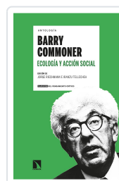
ANTOLOGÍA BARRY COMMONER ECOLOGÍA Y ACCIÓN SOCIAL RIECHMANN, JORGE/TELLECHEA, IRANZU