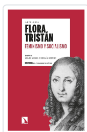
FEMINISMO Y SOCIALISMO TRISTÁN, FLORA