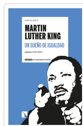
ANTOLOGÍA MARTIN LUTHER KING. UN SUEÑO DE IGUALDAD GOMIS, JOAN / DEL BUEY CANAS, RAMÓN