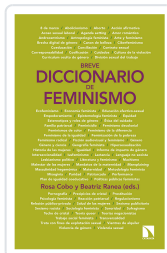
BREVE DICCIONARIO DE FEMINISMO COBO BEDIA, ROSA / RANEA TRIVIÑO, BEATRIZ