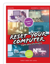
RESET YOUR COMPUTER. INGLÉS PARA INFORMÁTICA DÍAZ CUERTOS, BLANCA JIMENA