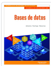
BASES DE DATOS POSTIGO PALACIOS, ANTONIO