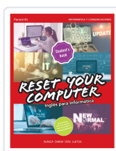
RESET YOUR COMPUTER. INGLÉS PARA INFORMÁTICA DÍAZ CUETOS, BLANCA JIMENA