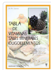
TABLA DE VITAMINAS, SALES MINERALES, OLIGOELEMENTOS DOROSZ, PH.