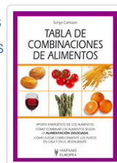
TABLA DE COMBINACIONES DE ALIMENTOS CARLSSON, SONJA