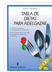
TABLA DE DIETAS PARA ADELGAZAR BIELEFELD, JOCHEN G.