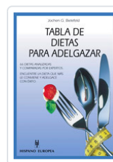
TABLA DE DIETAS PARA ADELGAZAR BIELEFELD, JOCHEN G.