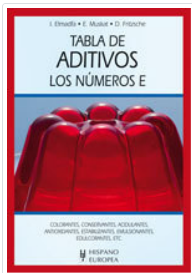
TABLA DE ADITIVOS. LOS NÚMEROS E

ELMADFA, IBRAHIM; MUSKAT, ERICH; FRITZSCHE, DORIS