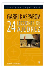
24 LECCIONES DE AJEDREZ KASPAROV, GARI