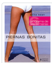
PIERNAS BONITAS BEAN, ANITA