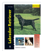
LABRADOR RETRIEVER DUKE, BERNARD