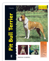
PIT BULL TERRIER FAVORITO, F.